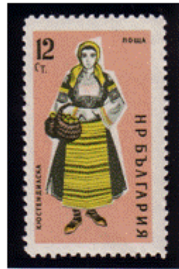
Frauentracht aus Küstendil

Juni 1970 - Mi.Nr. 2013-2016 Weltausstellung EXPO 70