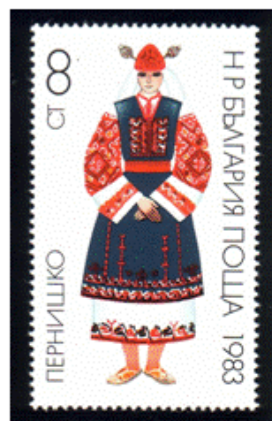
Frauentracht aus Pernik

Mai 1983 - Mi.Nr. 3168-3173 Volkstrachten III