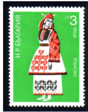
Frauentracht aus Trun