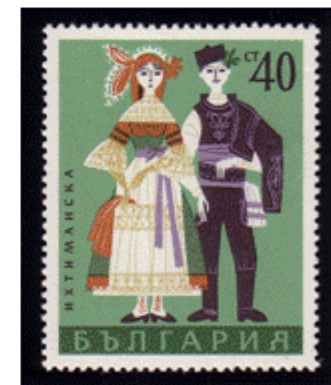
Trachtenpaar aus Ichtiman