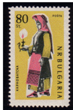
Frauentracht aus Karnobat