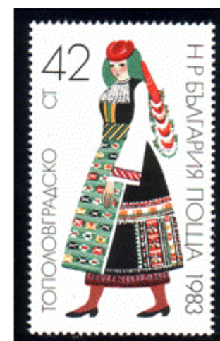
Frauentracht aus Topolovgrad