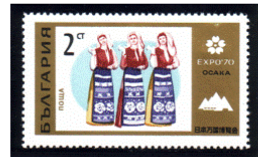
Bulgarinnen in Nationaltracht