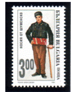
Männertracht aus Sumen