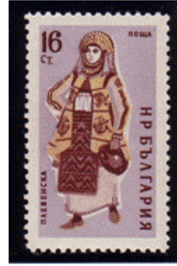
Frauentracht aus Plevna