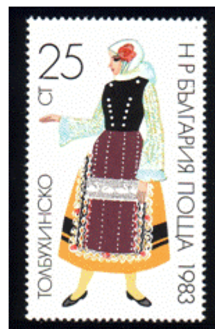
Frauentracht aus Tolbuchin