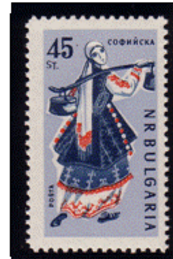
Frauentracht aus Sofia