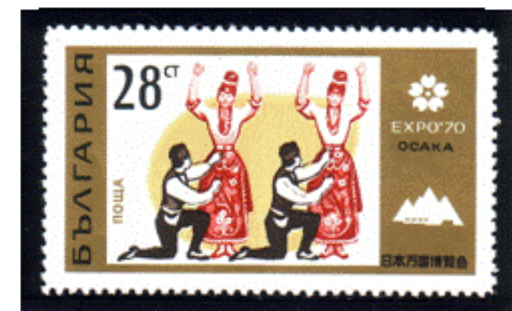
Trachtenpaare beim Tanz