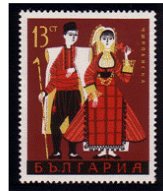
Trachtenpaar aus Tschirpan