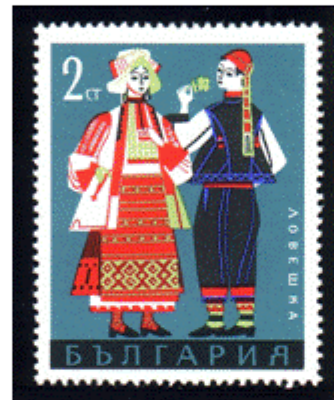
Trachtenpaar aus Lovetsch

Nov. 1968 - Mi.Nr. 1842-1847 Volkstrachten II