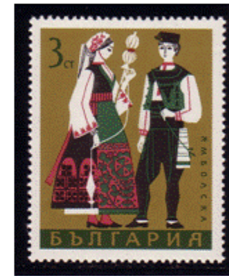
Trachtenpaar aus Ijambol