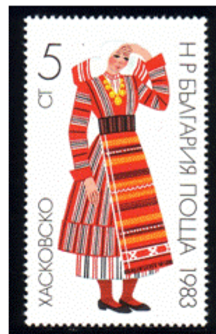
Frauentracht aus Haskovo