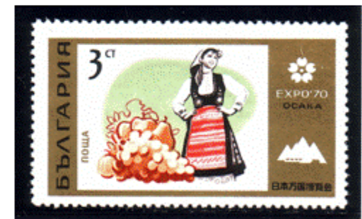
Frauentracht mit Obst