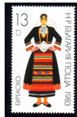
Frauentracht aus Burgas