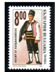
Männertracht aus Kuyrdzhali