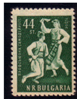
Trachtenpaar beim Volkstanz „Ratschenitza“

Juli 1957 - Mi.Nr. 1031 Weltfestspiele der Jugend