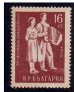
Trachtenpaar mit Akkordeon

Dez. 1953 - Mi.Nr. 898-899 Amateurtheater