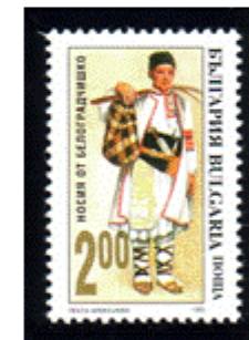
Männertracht aus Belograd