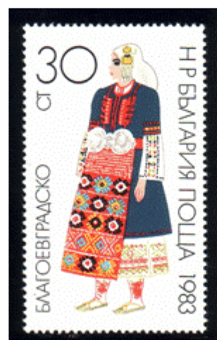
Frauentracht aus Blagoevgrad