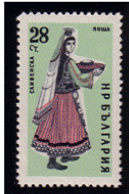
Frauentracht aus Sliwen