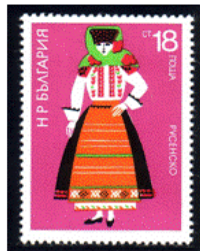
Frauentracht aus Russe