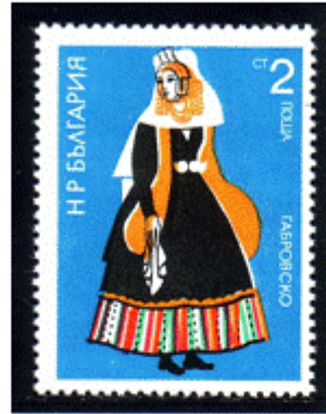
Frauentracht aus Gabrovo