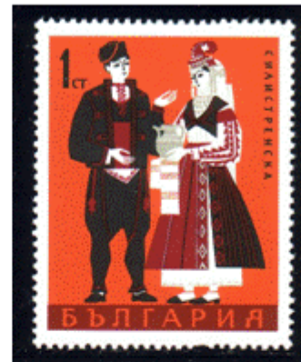
Trachtenpaar aus Silistra