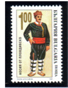
Männertracht aus Plovdiv