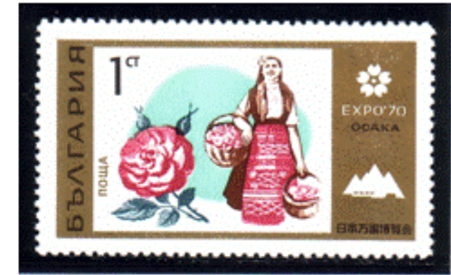
Frauentracht mit Rosen