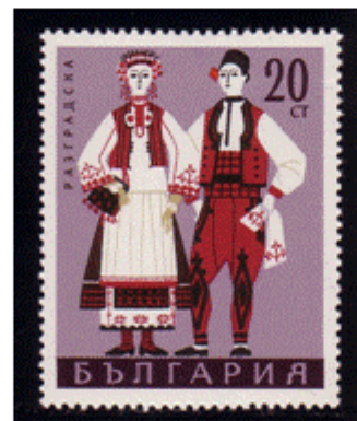
Trachtenpaar aus Razgrad