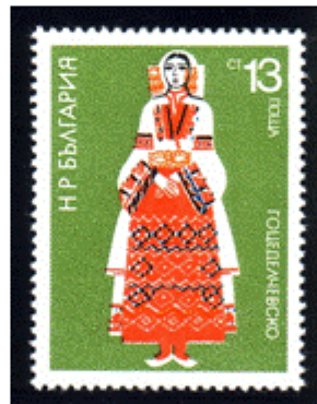
Frauentracht aus Gocce Delcyev