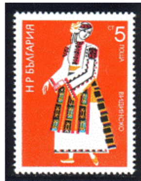
Frauentracht aus Vidin