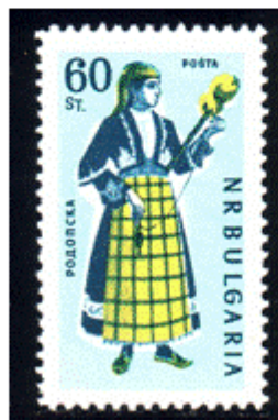
Frauentracht aus Rhodopen