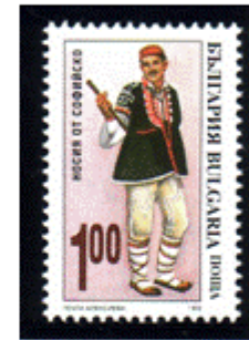
Männertracht aus Sofia