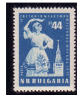
Volkstanzerin in Tracht

Juli 1957 - Mi.Nr. 1031 Weltfestspiele der Jugend