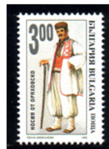
Männertracht aus Oryakhovitsa